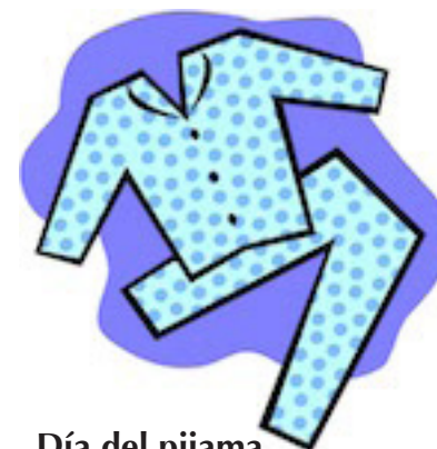
Día del pijama