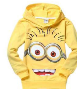
día del ESPÍRITU