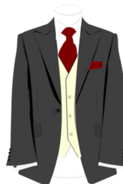
Día de Presencia Personal